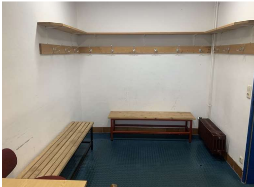
Schiedsrichterkabine wenn 2 bzw. 3 Schiedsrichter anwesend sind